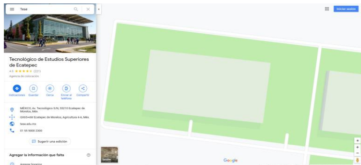
Fig. 3. Plataforma Google Maps.

En esta parte del sistema se buscará la imagen satelital, que se utilizará como referencia, en este caso para el análisis y como prueba del sistema. En esta sección se toma como referencia al Tecnológico de Estudios Superiores de Ecatepec, en específico el edificio de la división de informática como ejemplo, como se muestra en las figuras 3 y 4 respectivamente. Una vez obtenida la imagen es posible notar que en la parte inferior derecha contiene una medida de referencia aproximada, que se tomará como referencia en el sistema para aproximar una unidad de medida (véase figura 5).