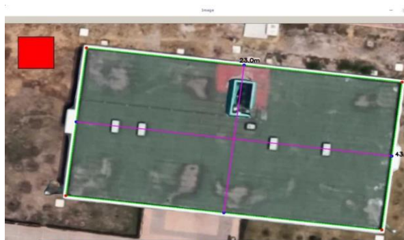
Fig. 8. Medición de objetos.

Para finalizar, como resultado se muestran las medidas obtenidas en metros sobrepuestas a la imagen como se observa en la figura 8, que permitirá realizar los cálculos correspondientes para encontrar los valores requeridos.