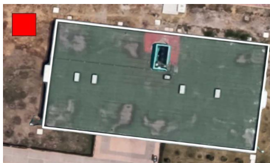
Fig. 6. Imagen satelital con referencia de medida.

Una vez obtenida la referencia, el sistema almacena el número de píxeles obtenidos de la aproximación métrica, con lo que genera una referencia visual que utiliza para una vez detectados los objetos sea posible comparar las dimensiones de cada objeto con el valor, generando una escala entre píxel por metro o número de píxeles en un metro de la misma manera en que se obtiene la referencia de la imagen satelital, en este paso por medio del procesamiento de imágenes se agrega dicha información. El resultado será algo similar a lo que se muestra la figura 6, en donde se puede ver el archivo en la etapa de procesamiento, parte en que se agrega el referente visual para el análisis de las dimensiones de las estructuras detectadas en la fotografía.